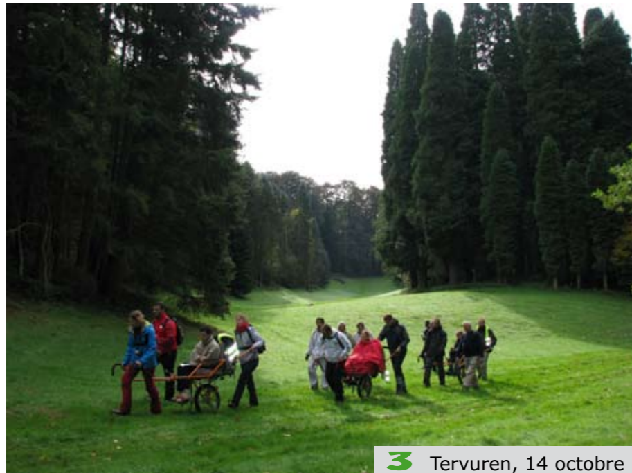
3 Tervuren, 14 octobre