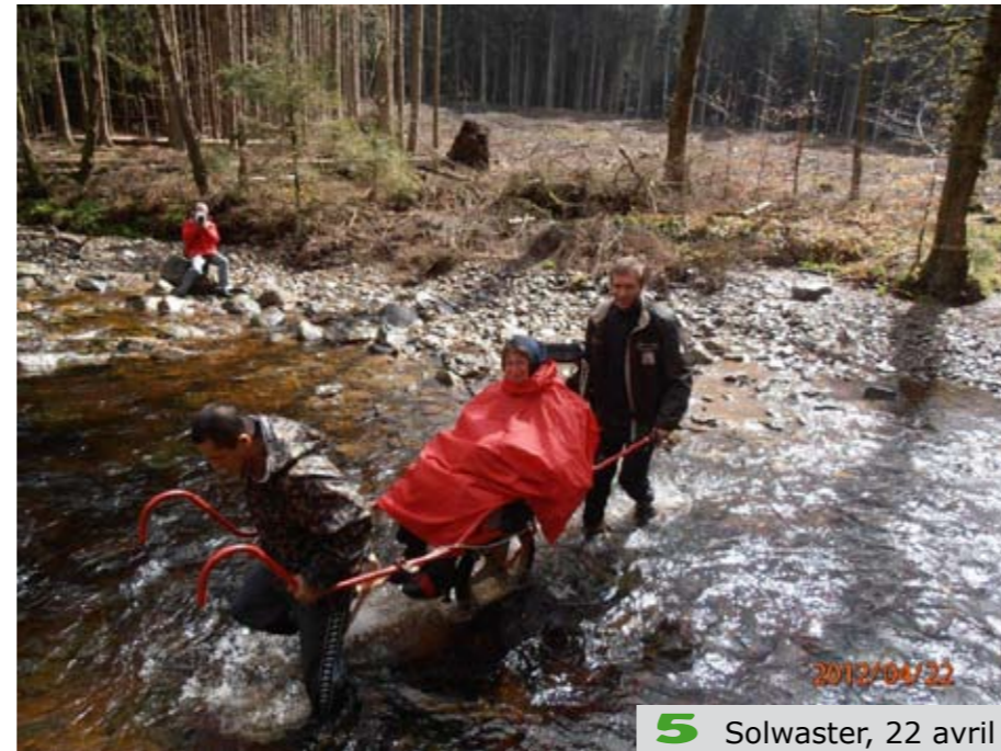
5 Solwaster, 22 avril