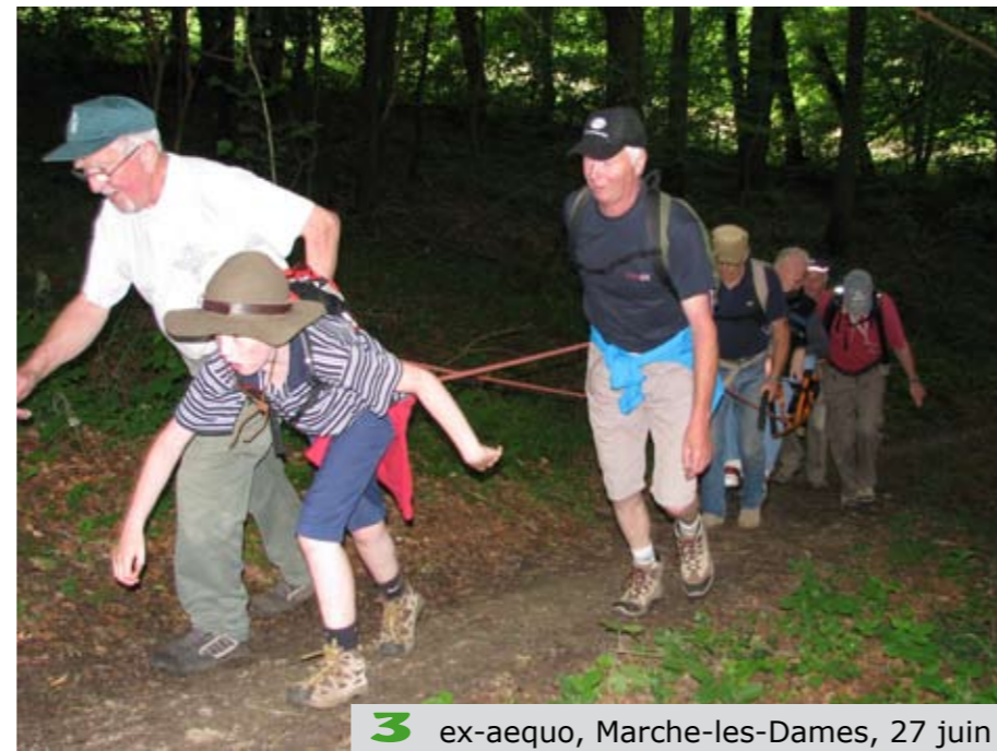
3 ex-aequo, Marche-les-Dames, 27 juin