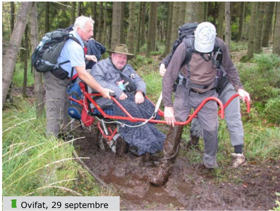
1 Ovifat, 29 septembre