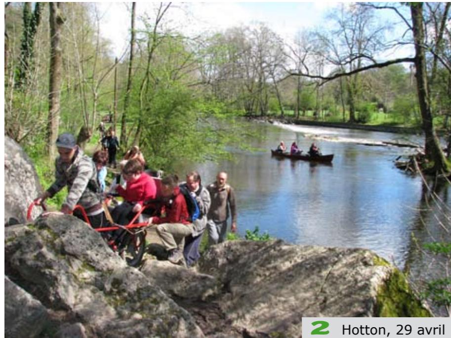
2 Hotton, 29 avril