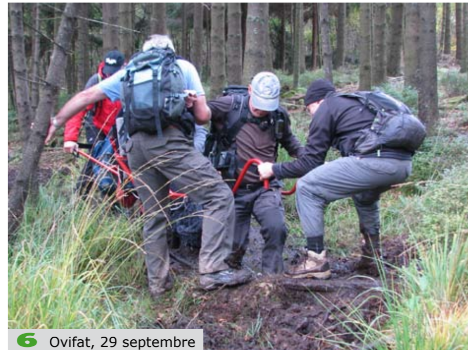
6 Ovifat, 29 septembre