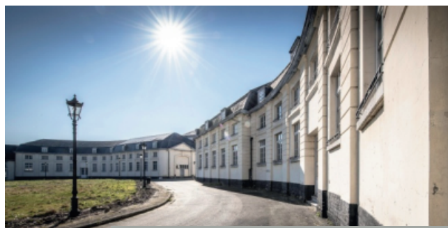
Hôtel et appartements Panquin actuels