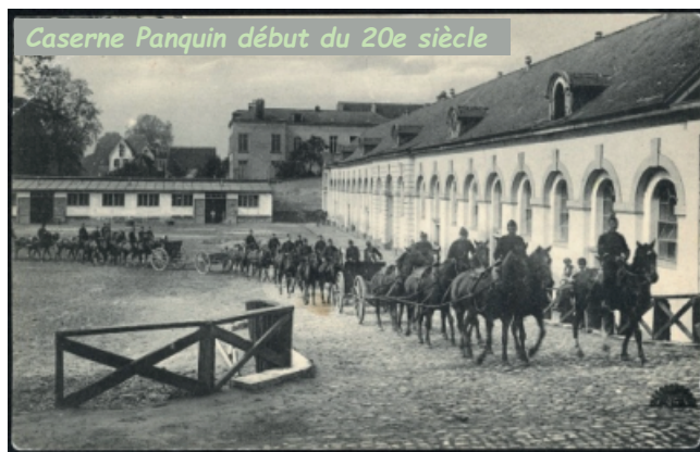
Caserne Panquin début du 20e siècle

En parlant de chevaux... Face à la chapelle Saint-Hubert se trouvent les anciennes écuries du château en forme de « fer à cheval ». Ce bâtiment a été transformé en caserne militaire, la caserne Panquin. Cette caserne a fermé ses portes en 2014 après 116 ans de présence militaire. Le site a été récemment réhabilité dans un projet immobilier comprenant hôtel et appartements de luxe.