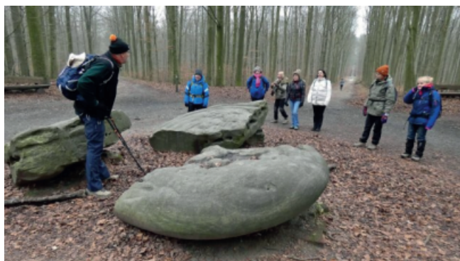
L'Étoile à sept branches

Après le pique-nique, nous reprenons notre route dans la partie boisée du parc et atteignons « l'Étoile à sept branches », un carrefour forestier vers lequel convergent en réalité douze sentiers. Trois pierres de grès ont été déposées à cet endroit en 1883 par un fermier de Duisburg qui les avait trouvées dans son champ : éclats de météorites, restes de dolmens, autels de druide... Peu importe ! Léopold II estimant ces mégalithes très décoratifs les a achetés pour l'équivalent de la modique somme de 3,72€ !