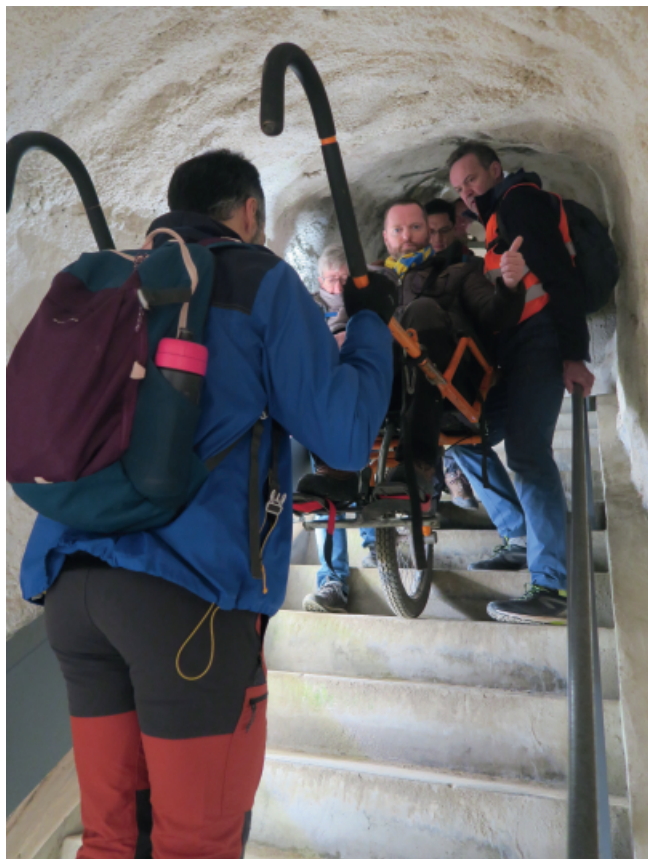
Le 15 mars à Namur