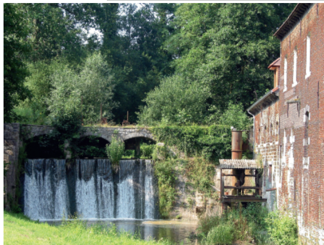
Le moulin abbatial de Saint-Denis