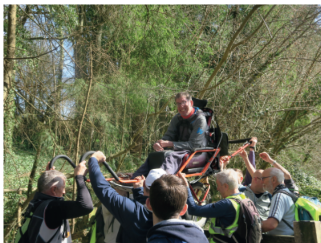
Le 23 mars à Saint-Denis