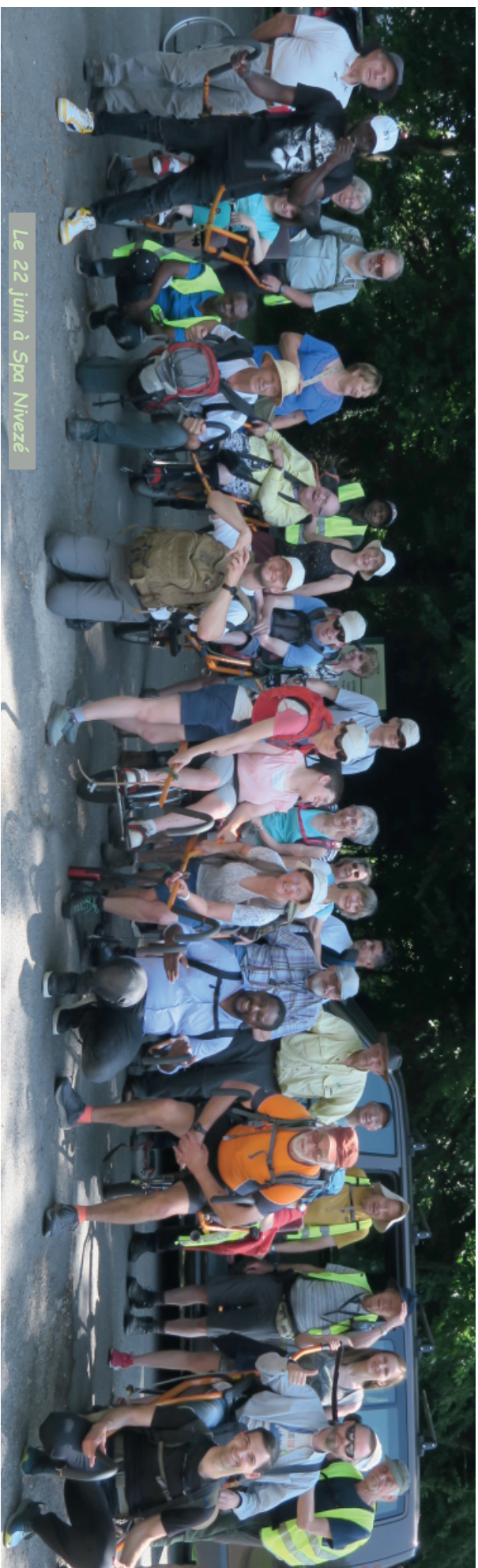
Le 22 juin à Spa Nivezé