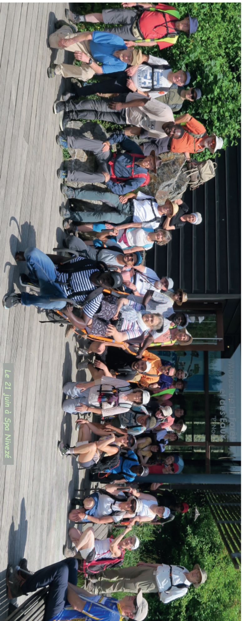
Le 21 juin à Spa Nivezé