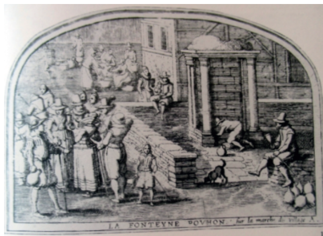
Dessin de la fontaine Pouhon par Jan Brueghel

Les bobelins disposaient de beaucoup de temps libre et il fallait les divertir, d'où de nombreuses maisons de jeux et, plus tard, un casino. En 1612, Jan Brueghel y a fait un séjour et nous a laissé un carnet de voyages dont les nombreux dessins permettent de se faire une idée du Spa de cette époque.