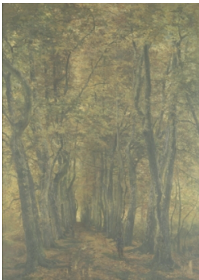
Allée des vieux charmes, Tervuren Hypolite Boulenger

Avant de quitter le fer à cheval, nous jetons encore un œil vers les ruines du château et la vue sur la partie plus sauvage du parc, bordée de la forêt de Soignes. Le soleil est déjà plus bas et les couleurs sont chatoyantes... Pas étonnant que des peintres se soient attardés ici avec leur chevalet. L'École de Tervuren était un rassemblement d'artistes belges de la seconde moitié du 19 e siècle qui privilégiait un art réaliste et naturaliste. Les artistes de ce mouvement cherchaient à représenter la nature de manière fidèle ; ils ont été inspirés par les artistes de Barbizon dans leurs représentations de la nature, de la lumière et de l'atmosphère. Le paysage a été le sujet central de leurs œuvres avec une attention particulière à la forêt de Soignes et de ses environs.