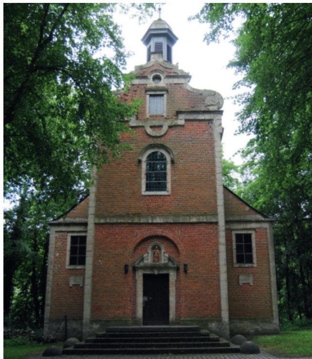
La chapelle Saint-Hubert

En parlant de chiens, savez-vous que quatre races de bergers belges sont nées chez nous au début du 19e siècle ? Le berger belge de Tervuren est une de ces quatre races, les autres étant le Groenendael, le Lae-